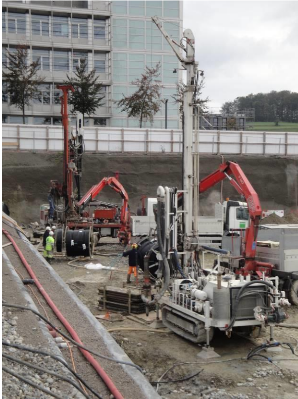
Zwei der insgesamt sieben Bohrgeräte auf dem Sondenfeld 3. Etappe ETH Zürich in Aktion (208 Stk. Erdwärmesonden à 200m)